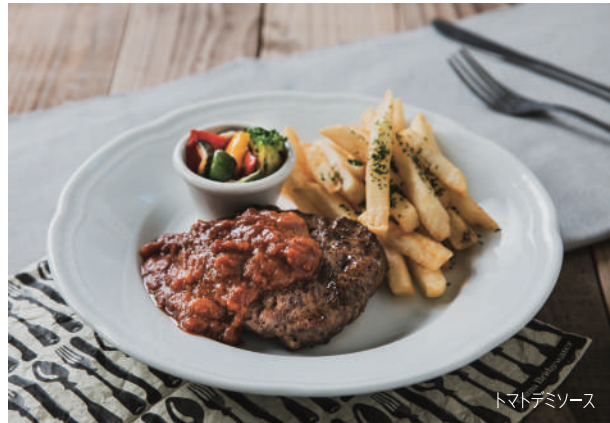
トマトデミソース