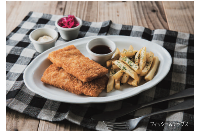
フィッシュ&チップス